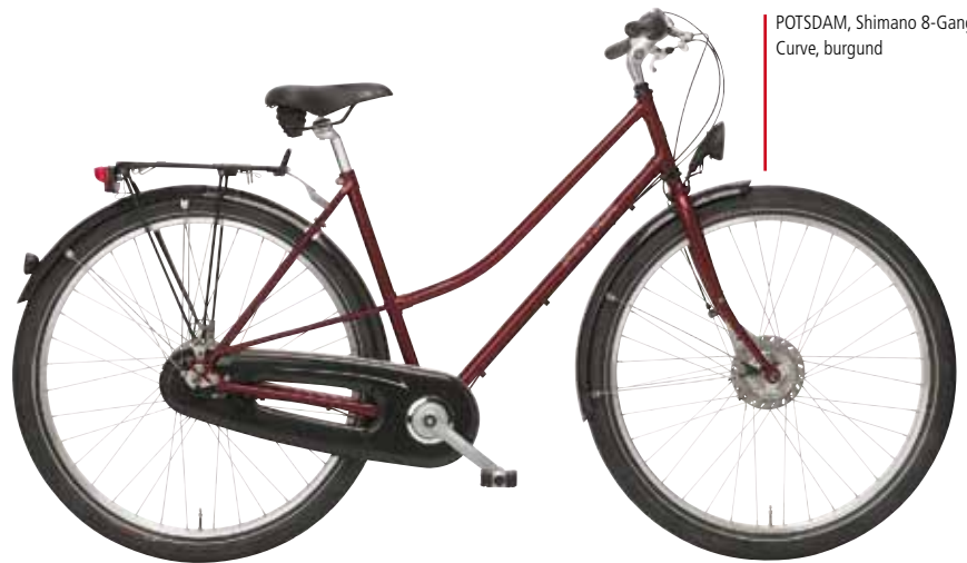
POTSDAM, Shimano 8-Gang, Curve, burgund